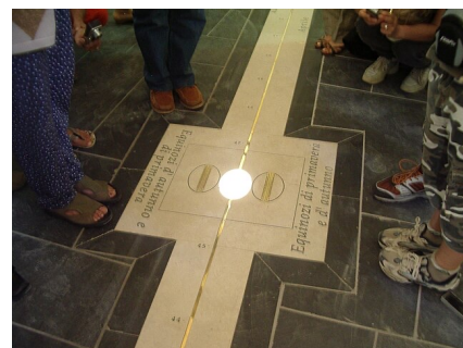
Tâche lumineuse du Soleil aux équinoxes sur le plancher du sanctuaire de N.D. de la Visitation à Perinaldo