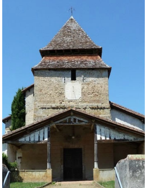
Cadran solaire de l'église Saint-Candide de Bougue (Landes)