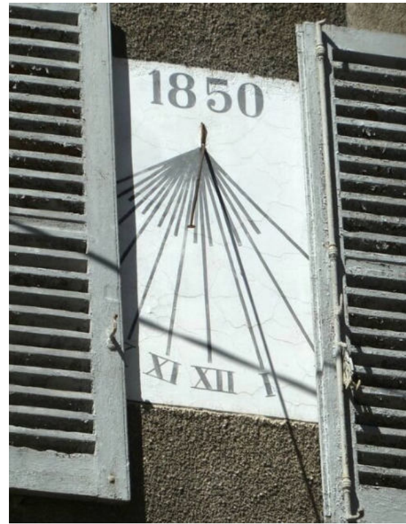
Cadran solaire à Aubusson (Creuse)