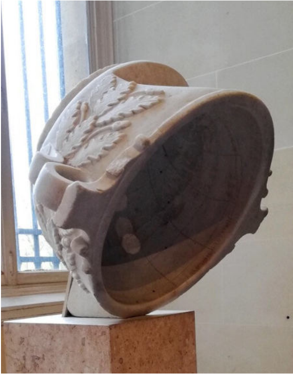
Scaphé au Louvre (Paris)